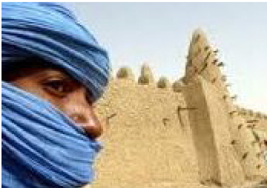
Touareg au Sahel