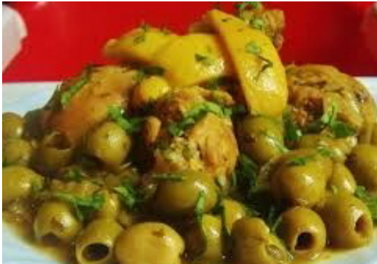
Tagine aux olives