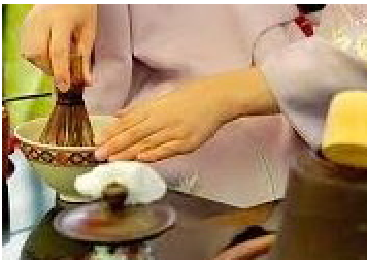
Cérémonie du thé au Japon